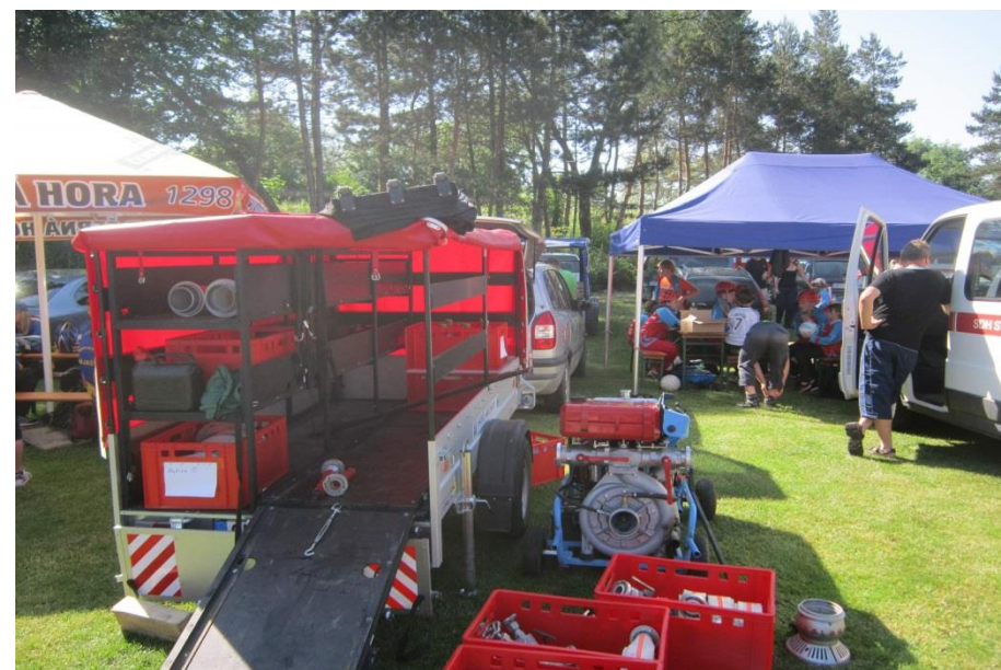
Doprava požární stříkačky na soutěž v Rájci Jestřebí 6. 6. za osobním automobilem a detail sklápěcího výsuvného pojezdu pro naložení stříkačky a čerpadel.