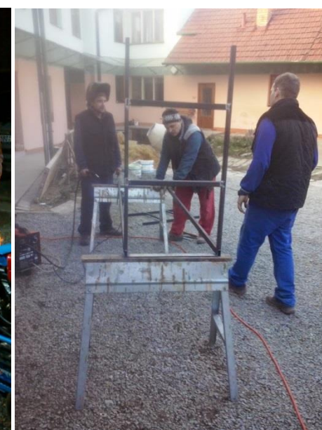
Výroba vestavby – montáž výsuvného pojezdu na agregáty a bedny.