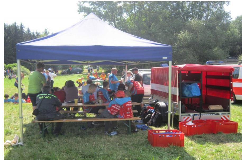
Využití přívěsu na dopravu vybavení na soutěž mládeže 27. 6. včetně využití části „týlového zázemí“ pro děti po dobu soutěže.