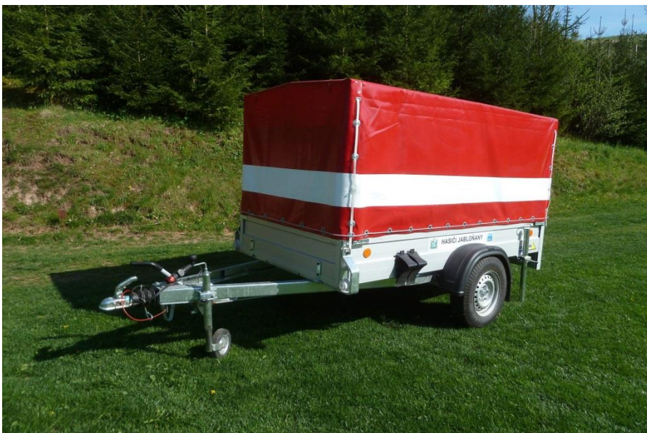
Valníkový brzděný přívěs (nosnost v terénu 1,3 t, ložná plocha 1,25 x 2,5 m), hliníkové bočnice a plachta v hasičském barevném provedení dle vyhlášky.