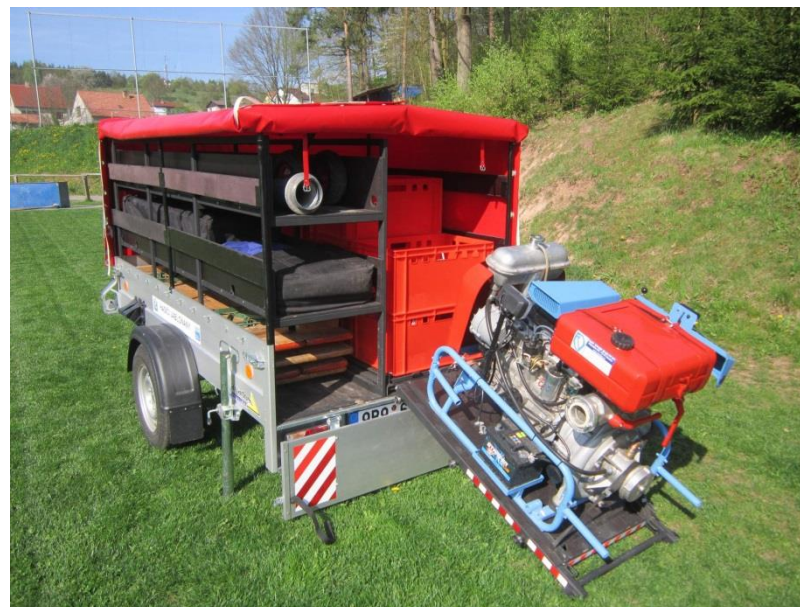
Vestavba pro uložení vybavení (regály vlevo) a ložiskový pojezd (vpravo) pro vysunutí požární stříkačky, dalších agregátů nebo přepravek.