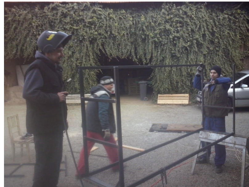
Výroba vestavby – svařování konstrukce na regály.