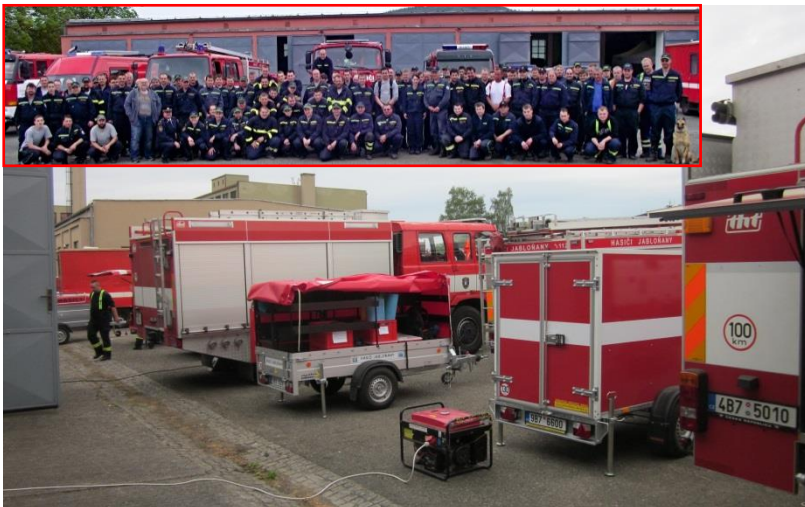
Přívěs při využití Jednotkou SDH obce, týlové zázemí 22. a 23. 5. 2015 při krajském Instruktažně metodickém zaměstnání pro JSDH OOB v Tišnově.