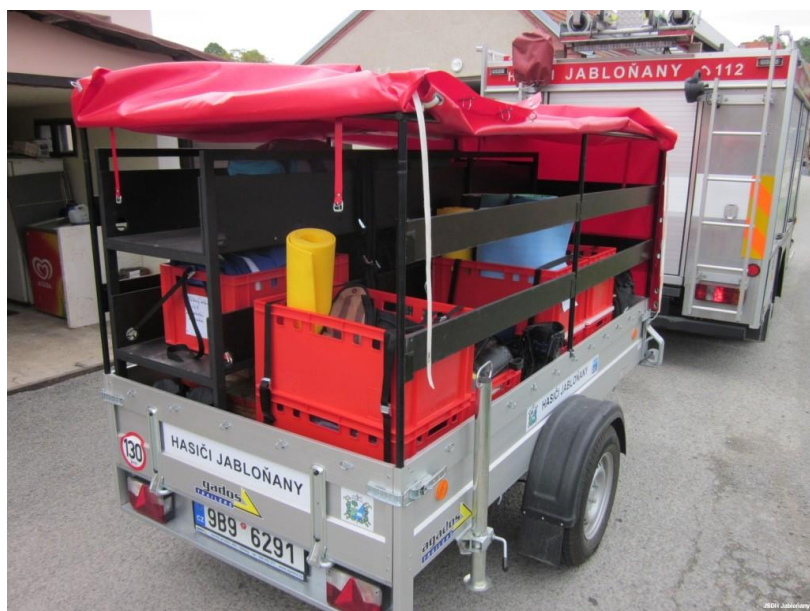
V rámci JSDH k OOB JPO-V v JMK slouží k přepravě týlového zázemí (stan, lavice, vč. nápojů a částečně stravy, pro dlouhotrvající zásahy i osobními prostředky hasičů pro přespání) a ostatním hasičským vybavením dle charakteru zásahu. Nyní v přepravkách uloženy prostředky pro provizorní zaplachtování střešních konstrukcí a další. V případě povodní bude doloženo dalšími čerpadly apod.