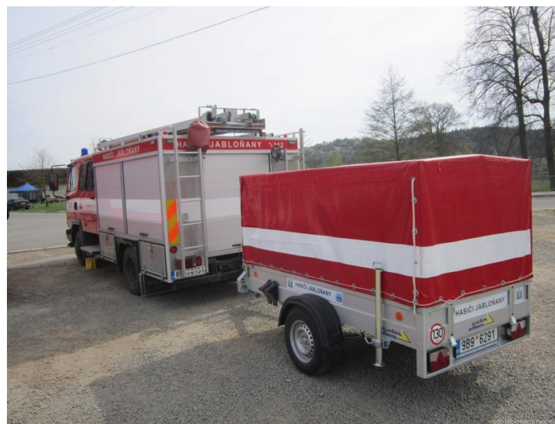
Přívěs je přepravován s CAS 15 nebo na dětské soutěže a tréninky zpravidla za osobním automobilem.