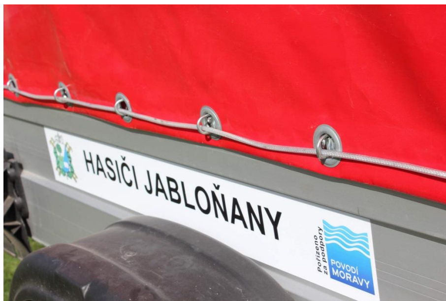
Domovenka a znak sboru s logem PMO („Pořízeno za podpory POVODÍ MORAVY“) trvale umístěným na obou stranách přívěsu.